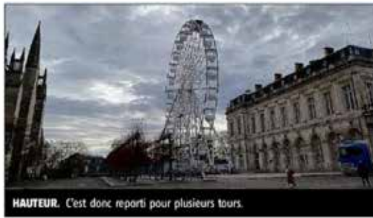
HAUTEUR. C'est donc reparti pour plusieurs tours.

Elle tourne donc bien avant le marché de Noël qui débutera le 13 décembre et continuera de le