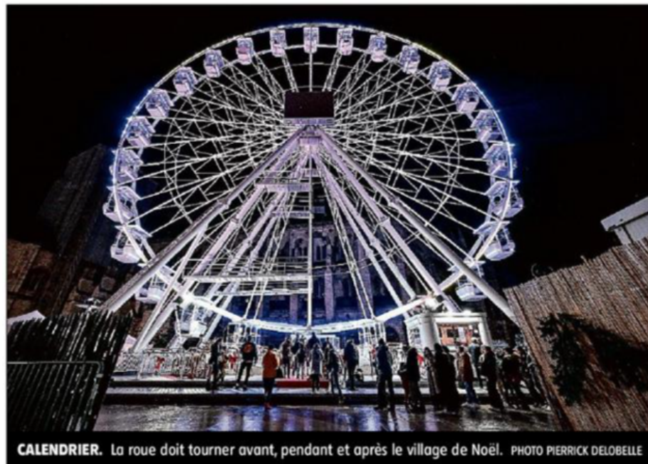
CALENDRIER. La roue doit tourner avant, pendant et après le village de Noël.

« Cela avait plutôt bien fonctionné l'an dernier et j'étais plutôt emballé par l'idée de revenir. Mais il fallait régler les derniers détails avant de confirmer mon retour à Bourges, explique Marvin Laso, pro-