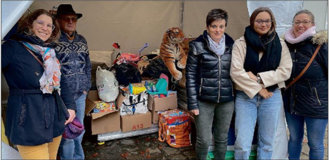
GÉNÉROSITÉ. Deux associations en ont bénéficié : le Secours populaire et la Fabrique à sourires.

Le marché de Noël de Bourges ( lire page précédente ) a recueilli environ quatre mètres cubes de jouets pour la grande satisfaction du Secours populaire et de la Fabrique à sourires.