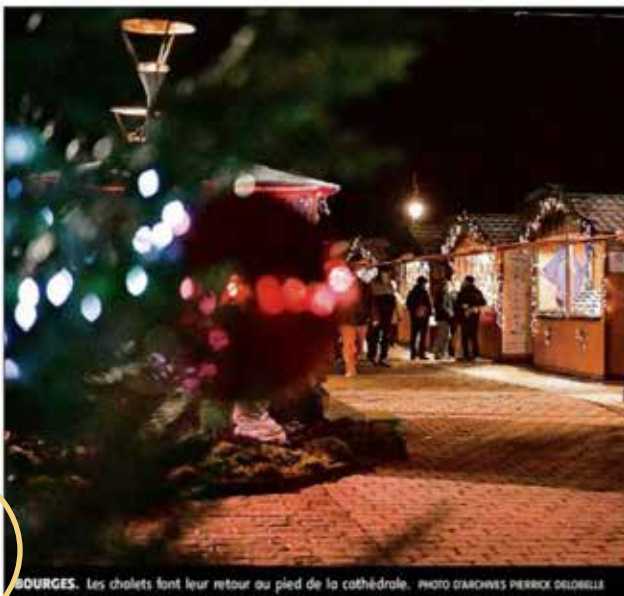
BOURGES. Les chalets font leur retour au pied de la cathédrale.

OIZON. La Grange au Breuzé. Aujourd'hui, à partir de 16 h 30, à 17 h 30, tirage ou sort de la tombola, à 18 heures, spectacle offert pour les en-