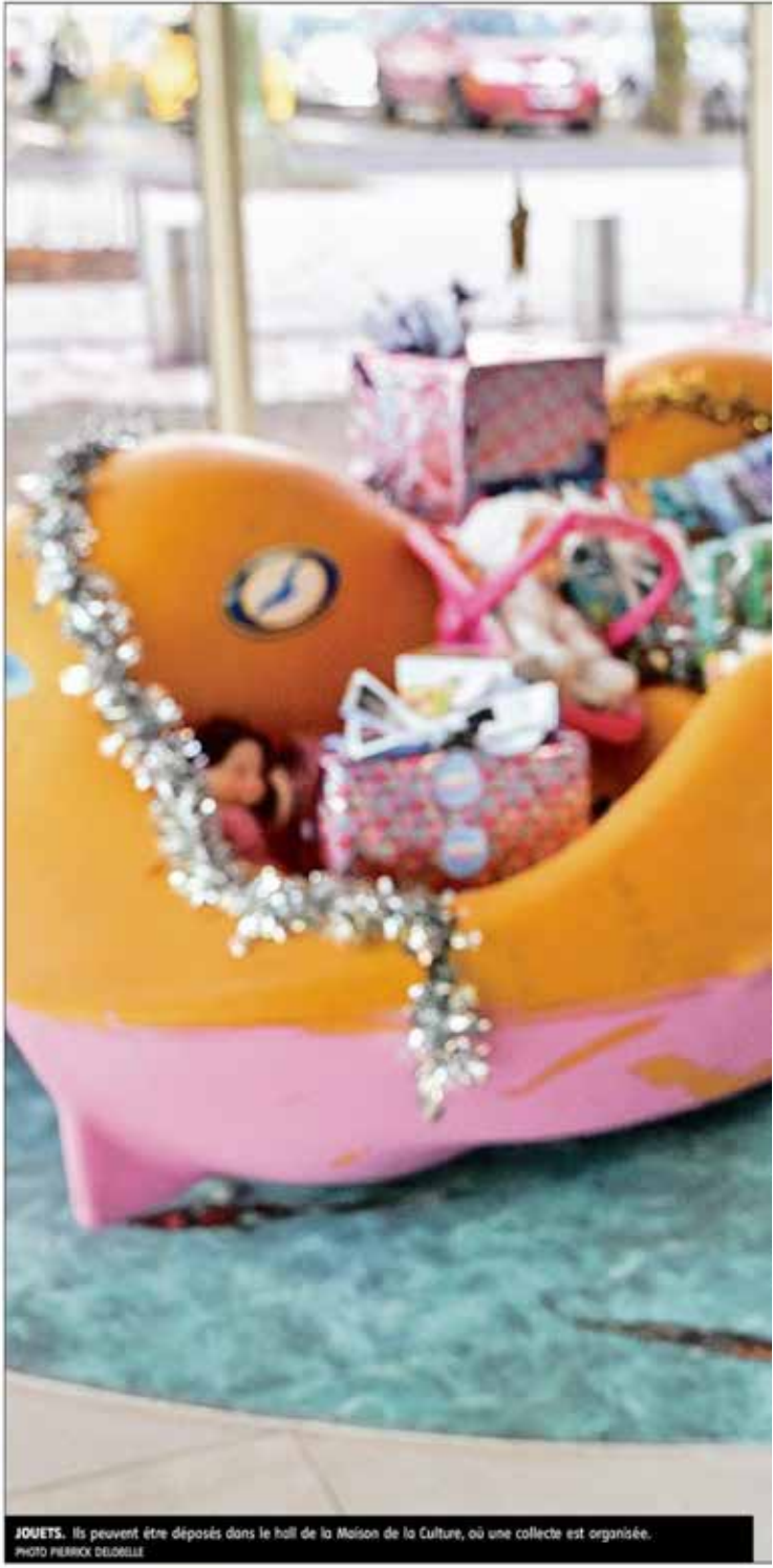
JOUETS. Ils peuvent être déposés dans le hall de la Maison de la Culture, où une collecte est organisée.

L'ensemble sera ensuite distribué, à égalité, entre la Fabrique