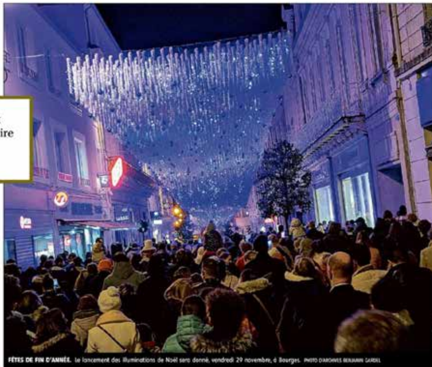
FÊTES DE FIN D'ANNÉE. Le lancement des illuminations de Noël sera donné, vendredi 29 novembre, à Bourges.

Dernière animation prévue, le feu d'artifice, le 31 décembre. Le rendez-vous est donné à 23 h 30, place Sénaucourt, pour assister à un spectacle de 15 minutes et passer à la nouvelle année. ■