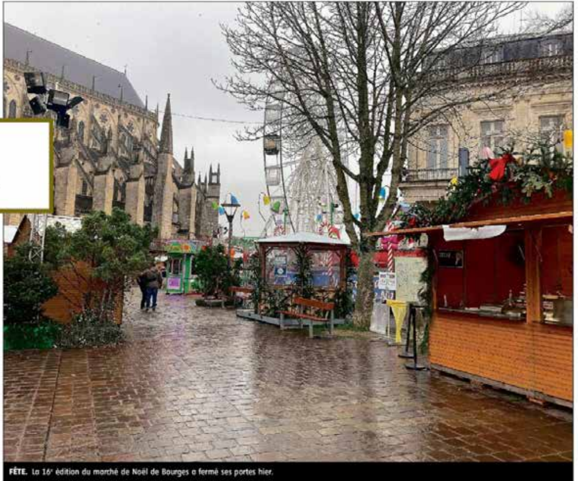
FÊTE. La 16 e édition du marché de Noël de Bourges a fermé ses portes hier.

Après onze jours d'ouverture, le marché de Noël de Bourges a fermé ses portes, hier. Les commerçants dressent un bilan positif.