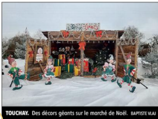
TOUCHAY. Des décors géants sur le marché de Noël. BAPTISTE VLAJ

MEHUN-SUR-YÈVRE. Place du Général-Leclerc. Demain, de 16 à 21 heures, et dimanche, de 10 à 18 heures. Plus de 70 exposants et de nombreuses animations. Samedi :